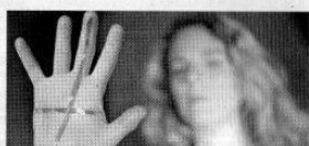
Σκηνές από την παράσταση «Ελπίς» της ομάδας «Οχι παίζουμε».

Ζει εδώ και 170 χρόνια, κουβαλάει κάτι από την επανάσταση του 1821, το Νοσοκομείο «Ελπίς» όπου νοσηλεύθηκε, πίστεψε, πάλεψε για το όραμά του καταφέροντας να γίνει και διοικητής του.